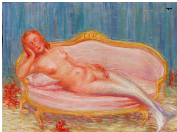
René Magritte (1898-1967) L'Univers interdit, 1943 Huile sur toile 60 x 81 cm Liège, collection de la fédération Wallonie- Bruxelles