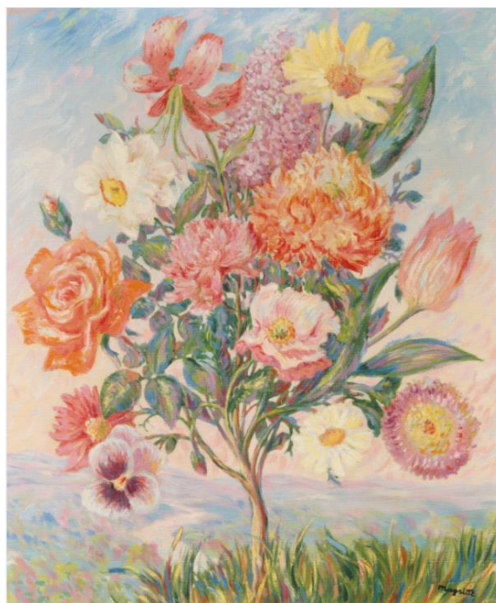
René Magritte (1898-1967) La Préméditation, 1943 Huile sur toile, 55 x 46 cm Collection privée

L'exposition réunit une soixantaine de peintures et une quarantaine de dessins. Elle s'ouvre sur quelques œuvres de la fin des années Trente dans lesquelles Magritte exprime l'imminence de la guerre et de désastres. Les tableaux de la période « Renoir » de Magritte sont mis en regard avec des chefs- d'œuvre de Renoir, des peintures contemporaines de Picabia et d'autres pièces, qui permettent d'esquisser une postérité à cette production peu connue.