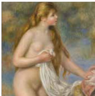
Огюст Ренуар, «Длинноволосая купальщица», 1885-1896 гг.

Первым местом работы Поля Гийома, происходившего из скромной семьи, была автомастерская. В 1911 году он выставил в витрине мастерской африканские статуэтки, которые привлекли внимание поэта Гийома Аполлинера, ставшего его наставником. Поль Гийом открыл первую галерею в 1912 году и начал коллекционировать произведения искусства и торговать ими. Вскоре Поль Гийом стал заметной фигурой в художественных и литературных кругах 1920-х гг., выступая очевидцем и меценатом тех лет. Он руководит журналом «Искусство в Париже», поддерживает Пикассо, Сутина, Дерена и Мари Лорансен, и специализируется в африканском искусстве, являющемся в то время источником вдохновения художников - авангардистов. Поль Гийом умер в 1934 году, не успев осуществить свой замысел о создании музея современного искусства. Коллекция Поля Гийома, дополненная и измененная его супругой, состояла из произведений современного классицизма и импрессионизма. В 1959 году она была выкуплена государством.