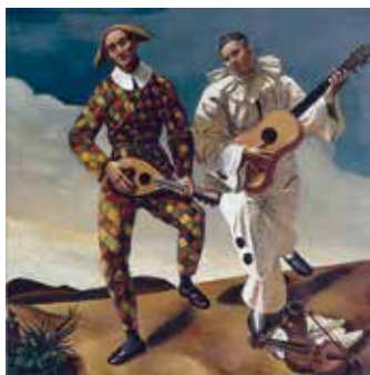
Андре Дерен, «Арлекин и Пьеро», 1923 г. © ADAGP, 2013 г.