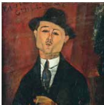
Амедео Модильяни, «Портрет Поля Гийома - Ново Пипога», 1915 г.