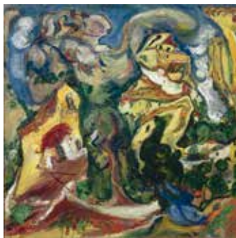
Хаим Сутин, «Деревня», около 1923 г. © ADAGP, 2013 г.