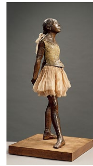
Edgar Degas, Petite danseuse de quatorze ans , 1932

Le XIX e siècle est jalonné de tableaux et de sculptures qui défraient la chronique. Ces œuvres provoquent des réactions indignées, des critiques, et parfois des débats. Mais elles ne sont pas le seul fait des avant-gardes et mêmes les œuvres les plus académiques appellent le scandale. Découvrez-les et préparez-vous au débat !