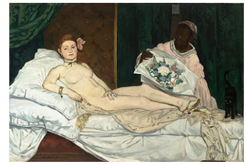
Édouard Manet, Olympia , 1863

Paris est, au début du XX e siècle, un lieu d'effervescence culturelle sans précédent. D'innombrables artistes français ou étrangers s'y installent, soucieux d'être au plus près des innovations artistiques qui se succèdent depuis l'époque des impressionnistes. De ce creuset où s'exposent les œuvres de Monet, Renoir ou Cézanne émergent des figures majeures – Matisse, Picasso, Soutine et d'autres. Suivez le guide pour assister à la naissance de l'art moderne !