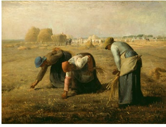
Jean-François Millet, Des glaneuses , 1857