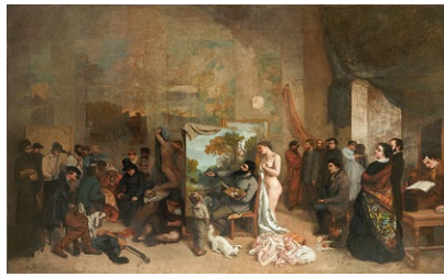
Gustave Courbet, L'Atelier du peintre , 1854-1855

Retrouvez dans cette séance les grands enjeux de l'exposition « Les Origines du monde. L'invention de la nature au XIX e siècle ». En 1859, Charles Darwin publie sa théorie de l'évolution des espèces. Cet événement, préparé par plusieurs décennies d'explorations et de recherches scientifiques, transforme radicalement la vision de l'homme et de la nature. Comment les arts du XIX e siècle se nourrissent-ils de toutes ces découvertes ?