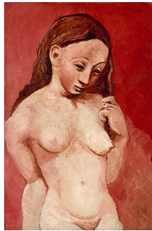
Pablo Picasso, Nu sur fond rouge , vers 1905-1906

La société connaît de profondes mutations au XIX e siècle, et ce jusque dans les manières de faire la fête ou de se distraire. Si l'Opéra, les ballets et les concerts ont leurs habitués, d'autres préféreront le bal populaire, la foire ou le cirque. Et pour les plus aisés, les joies du plein-air – régates et bains de mer – sont à portée de train. À vous l'embaras du choix !