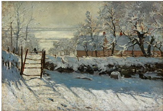
Claude Monet, La Pie , 1868-1869

Le musée d'Orsay est fameux bien sûr pour sa grande galerie de sculptures et ses collections de peinture impressionniste. Mais saviez-vous qu'il renferme bien d'autres trésors ? On y retrouve tous les champs de création de la période 1848-1914 : peinture et sculpture, mais aussi arts graphiques et décoratifs, architecture, photographie et cinéma... Partez à la découverte des pièces maîtresses des collections !