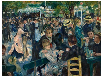
Auguste Renoir, Bal du moulin de la Galette , 1876

Il est l'un des peintres impressionnistes les plus connus : Claude Monet (1840-1926) vit et crée dans ces années charnières entre XIX e et XX e siècle, décisives pour la création artistique. Cette conversation à distance vous propose de découvrir son œuvre, depuis les toiles de ses jeunes années, telles La Pie , conservé au musée d'Orsay et jusqu'aux gigantesques Nymphéas , ultime don de l'artiste à l'État français – et à la postérité.