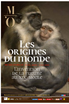
Affiche de l'exposition